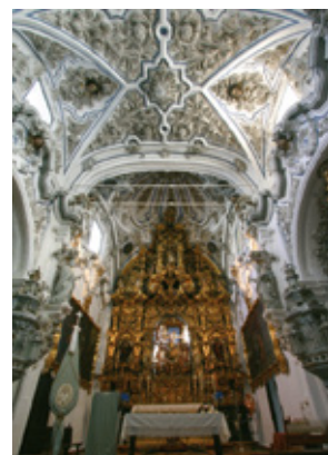
Intérieur de l'Église de La Aurora