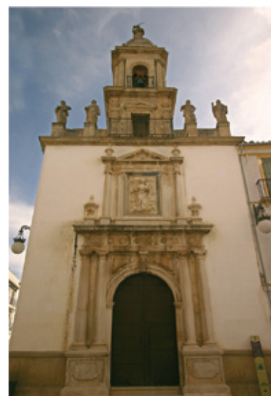
La Façade de l'Église de El Carmen