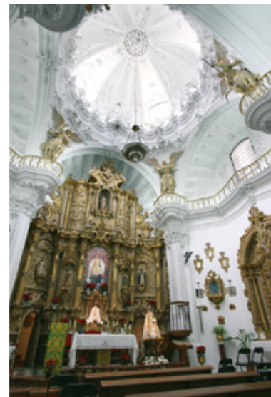
Intérieur de l'Église de Las Mercedes

Cet ermitage est à l'architecture religieuse et populaire. Elle a une façade du XVII e siècle, mais elle fut reconstruite au XVIII e siècle. Dans son intérieur, il y a une niche avec la sculpture de la Vierge avec l'Enfant Jésus et Saint Joseph. L'ermitage possède aussi une intéressante collection de tableaux des XVII e et XVIII e siècles.