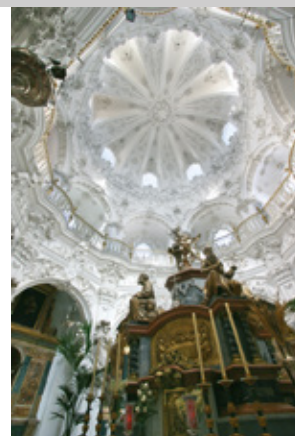
Sanctuaire de La Asunción