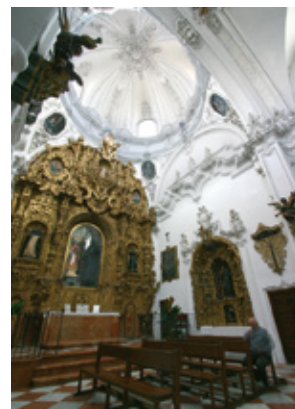
Intérieur de l'Église de San Francisco