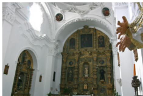
Intérieur de l'Église de San Juan de Dios