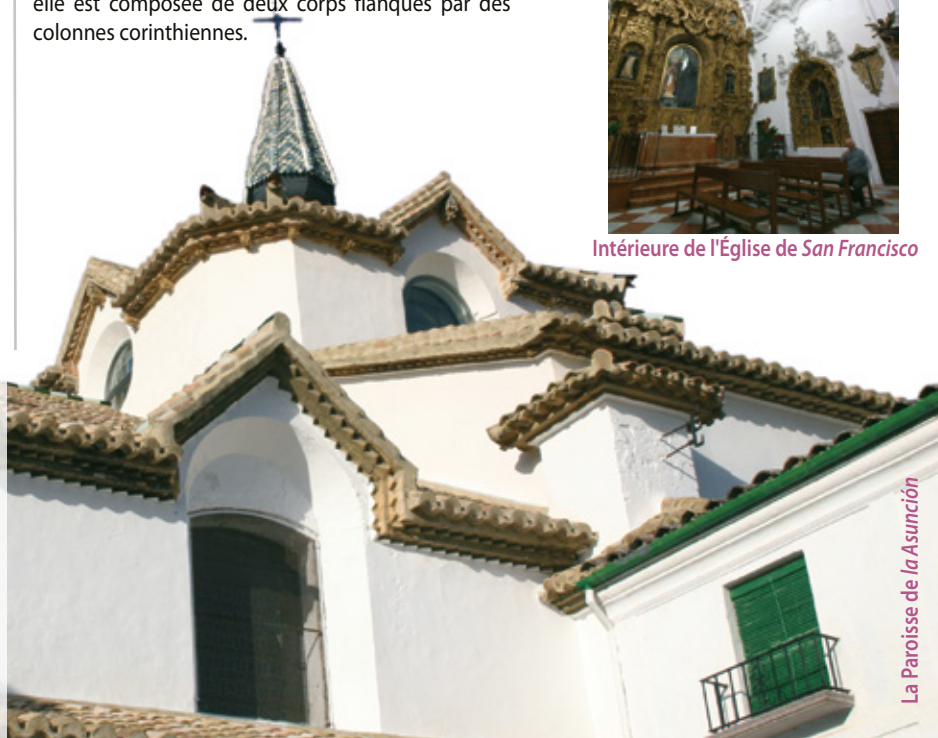
La Paroisse de La Asunción