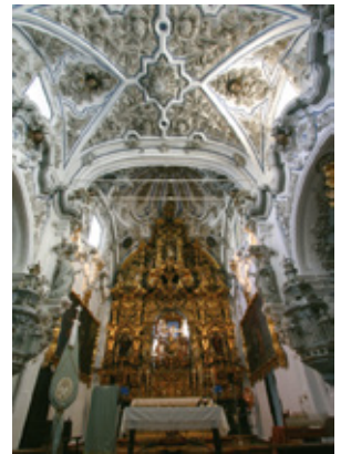
Interior Iglesia de la Aurora