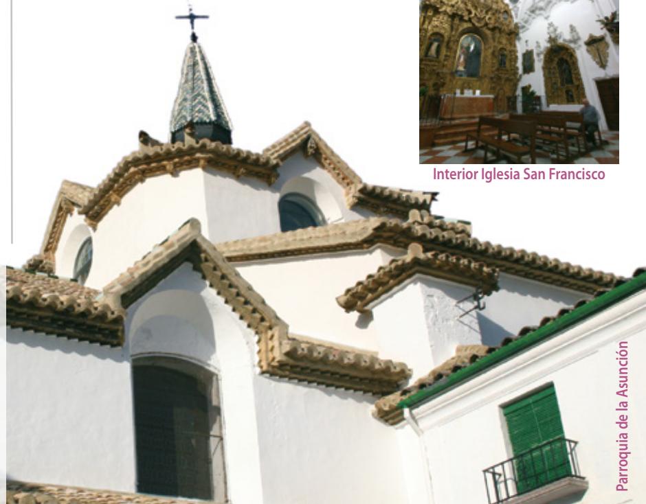
Parroquia de la Asunción