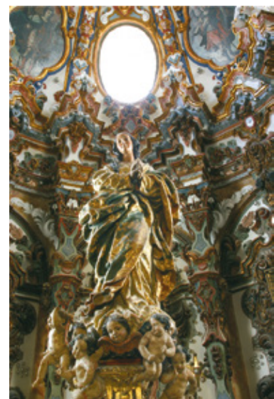
Interior de la Iglesia de San Pedro (Camarín)