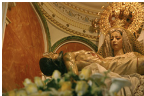
Imagen Virgen de las Angustias (Iglesia de las Angustias)