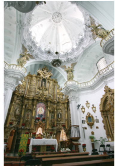
Interior de la Iglesia de las Mercedes

Pertenece a la arquitectura religiosa popular. Con su portada del siglo XVII fue reedificada en el siglo XVIII. En su interior está el camarín y, en éste, la Virgen de Belén con el Niño y San José. Pueden contemplarse varios lienzos interesantes, fechados en los siglos XVII y XVIII.