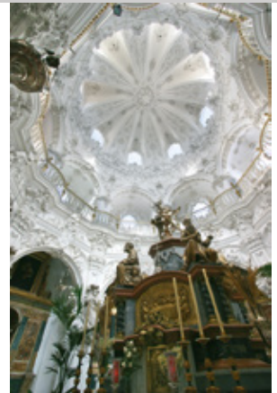
Sagrario de la Asunción

El convento de San Francisco se funda a principios del XVI, a instancias del Marqués de Priego, bajo la advocación de San Esteban; los franciscanos acometen poco después la construcción de la iglesia, finalizando las obras a mediados de siglo. En el siglo XVIII, el templo sufre transformaciones, conservándose tan sólo la planta salón y unas bóvedas góticas con decoración renacentista junto a la Sacristía. El autor de esta reforma fue Jerónimo Sánchez de Rueda y, posteriormente, Santaella. Destaca la Capilla de Jesús Nazareno construida en 1731, de planta hexagonal y decorada con yeserías doradas; en el camarín se venera la talla de gran calidad de Jesús Nazareno, de Pablo de Rojas. La talla de Jesús en la Columna, también de gran belleza y calidad, fue realizada por Pedro de Mena. La fachada exterior es del siglo XVIII, y se organiza como un gran muro cubierto por esgrafados; la portada es de mármol blanco y negro y consta de dos cuerpos, flanqueados por columnas corintias.